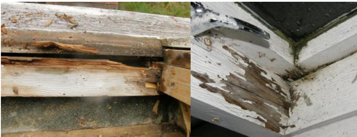
(Vinduer på sørsiden har omfattende skader til tross for mye kortere brukstid)