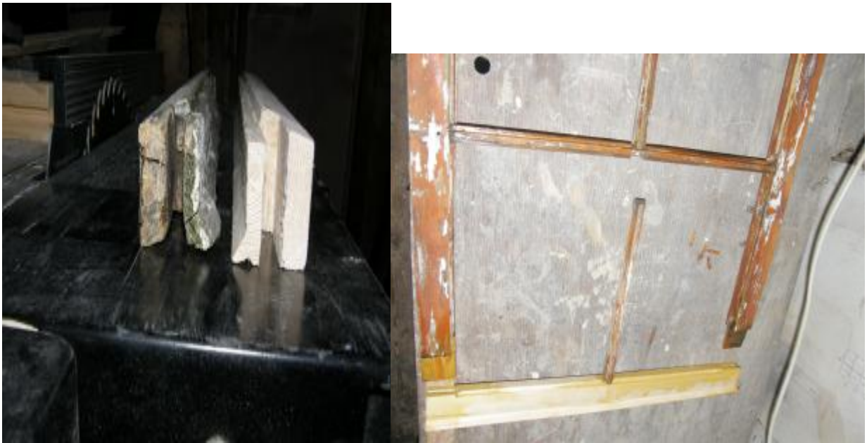
(Kopiering og montering av nedre lekt i vindusrammen. Vindu nr 6).

De gamle rammene er noe nedslitt og ujevn, men vi brukte mange strøk med linolje før maling og regner med at rammene vil holde i mange tiår